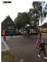
Ouders/verzorgers en kinderen wachten achter de pionnen

Voetgangers en fietsers wachten op het teken van de klaar-over