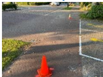
Wens je over te steken dan wacht je in het daarvoor bestemde vak (witte lijnen)