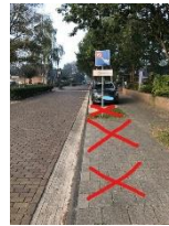
Niet parkeren achter de auto's van de leerkrachten (ook niet Tút-en-derút)

Liever helemaal niet parkeren op Sevenaerpad. Graag lang parkeren bij de kerk.