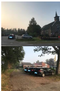
Sevenaerpad: 1 e 30 meter vrij houden

Voetgangers en fietsers wachten op het teken van de klaar-over