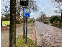
Parkeren bij de kerk

Parkeerhaven: 3 parkeerplaatsen (geen 4 of 5!) Alleen gebruiken voor Kiss en ride/ Tút-en-derút