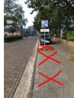
Niet parkeren achter de auto's van de leerkrachten (ook niet Tút-en-derút)