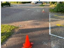
Wens je over te steken dan wacht je in het daarvoor bestemde vak (witte lijnen)