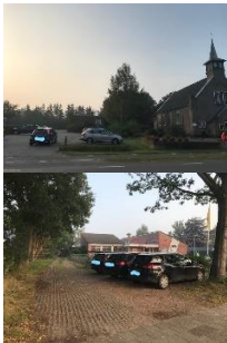
Sevenaerpad: 1 e 30 meter vrij houden

Liever helemaal niet parkeren op Sevenaerpad. Graag lang parkeren bij de kerk.