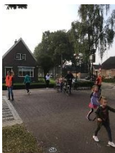
Ouders/verzorgers en kinderen wachten achter de pionnen

NIET met de fiets oversteken of de weg op gaan een paar meter verder dan de klaar- overs