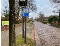
Parkeren bij de kerk